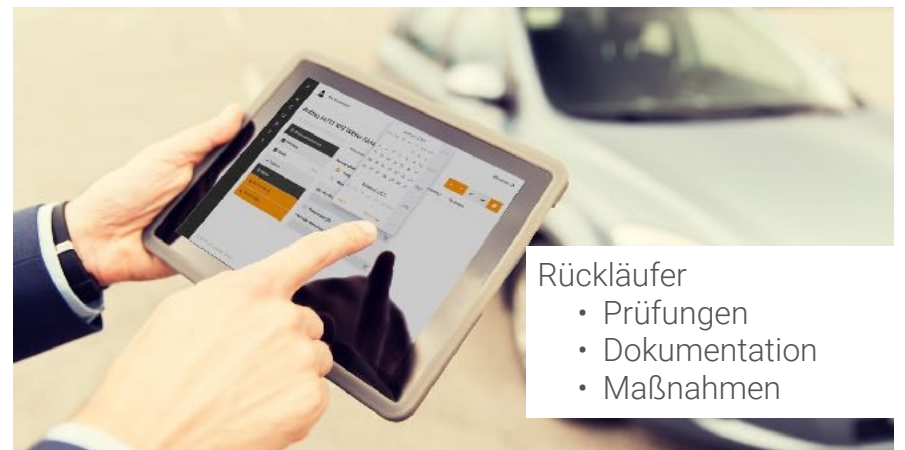
Rückläufer • Prüfungen • Dokumentation • Maßnahmen

Die Vorteile liegen auf der Hand: die gesamte Rücklaufabwicklung erfolgt aus einem Guß, effizienter und effektiver, der bisherige "Papierkrieg" entfällt, notwendige Dokumentation und Fotos gelingen mit wenigen Klicks in einem System. Die Abläufe werden schneller und transparenter, die Prozesskosten sinken, Rechnungen können schneller gestellt werden.